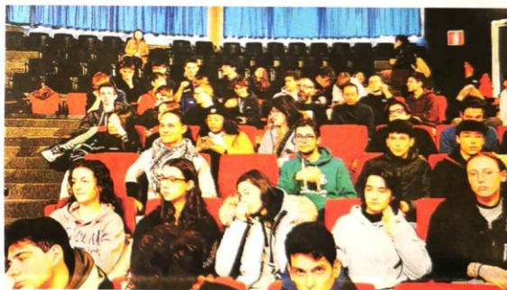
Gli studenti del pubblico