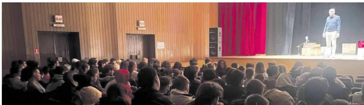
La scolaresca della SMSI "Leonardo da Vinci" di Buie allo spettacolo "Mili muoi"

Buie. Al teatro cittadino la prima tappa istriana dello spettacolo «Mili muoi. l'esodo dei miei» di e con Carlo Colombo, organizzata dalla CI in occasione del Giorno del ricordo. Seguiranno le repliche dello spettacolo a Cittanova, Fiume e Lussinpiccolo. Il prossimo mese ci sono già in programma 20 date in Italia