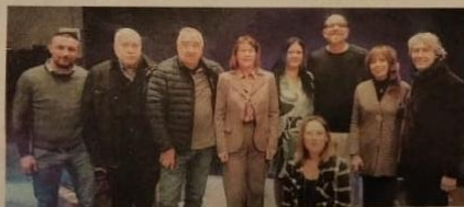
Amministratori, organizzatori e le persone che hanno portato le loro testimonianze

parlato poco e la discussione è rimasta limitata ai confini del Friuli Venezia Giulia e in posti come Trieste, Venezia, Udine - ha commentato